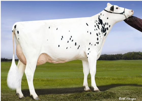
RICHMOND-FD LORELEI Dam